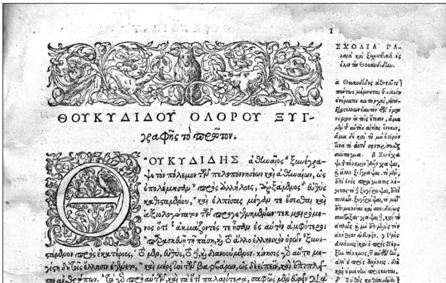
Abb. 3: Thukydides-Ausgabe mit Marginalscholien (1564), Graustufen, 300 dpi

che eine schärfere Wiedergabe der gerade im Bereich der Marginalscholien kleineren Buchstaben 76 , zum anderen wird die durch die Welligkeit der Vorlage bedingte Bildung von Querschatten auf den Seiten (erkennbar am unteren Rand der Abb. 3) reduziert.