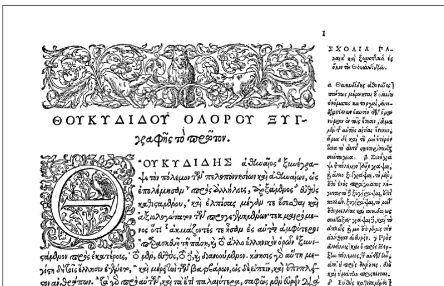
Abb. 4: Thukydides-Ausgabe mit Marginalscholien (1564), bitonal, 400 dpi